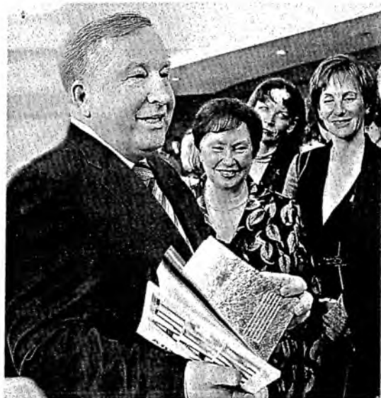
Губернатор Александр Карлин высоко оценил выставку книг, изданных на Алтае.