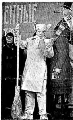
Модный сейчас флешмоб, конечно, тоже посвящался чтению. И в этом году число книг –

участников фестиваля, изданных по итогам 2014 года, составляет более 1,5 тысячи!»