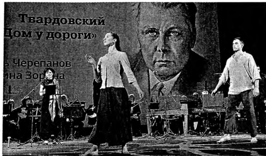
Звучали замечательные стихи А.Твардовского.

Александр Карлин напомнил, что Год литературы в крае начался с презентации