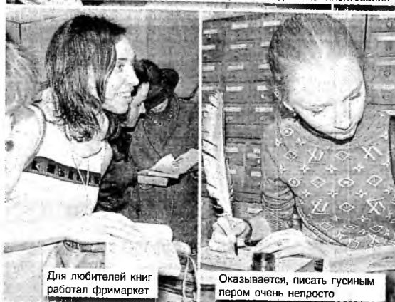
Для любителей книг работал фримаркет