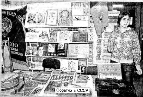
Обратно в СССР